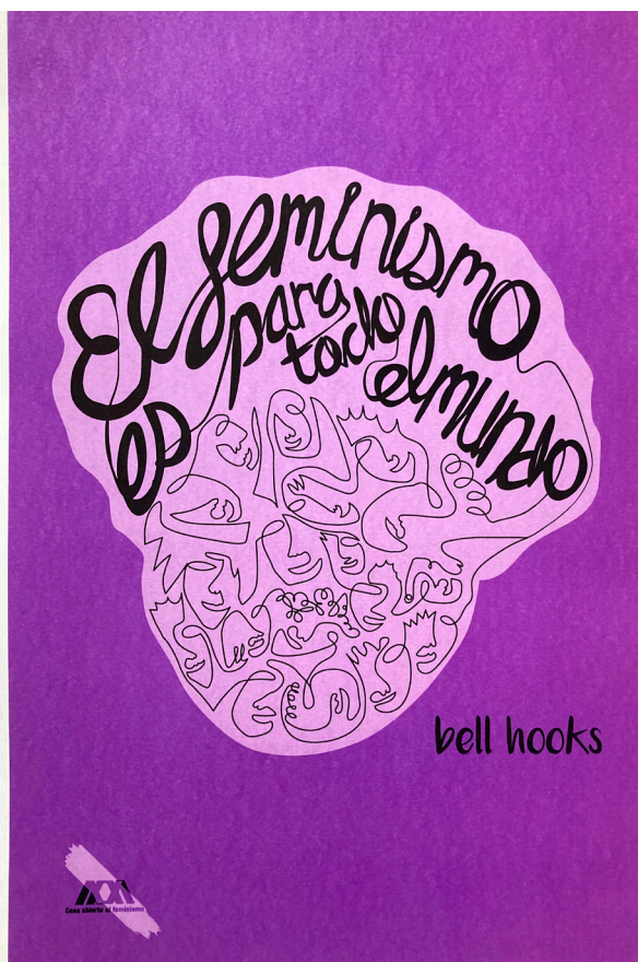
Figura 2 El feminismo es para todo el mundo

Nota. Cartel desarrollado en el Laboratorio de Diseño Integral III, trimestre 23-I, Salazar Medina, 2023.