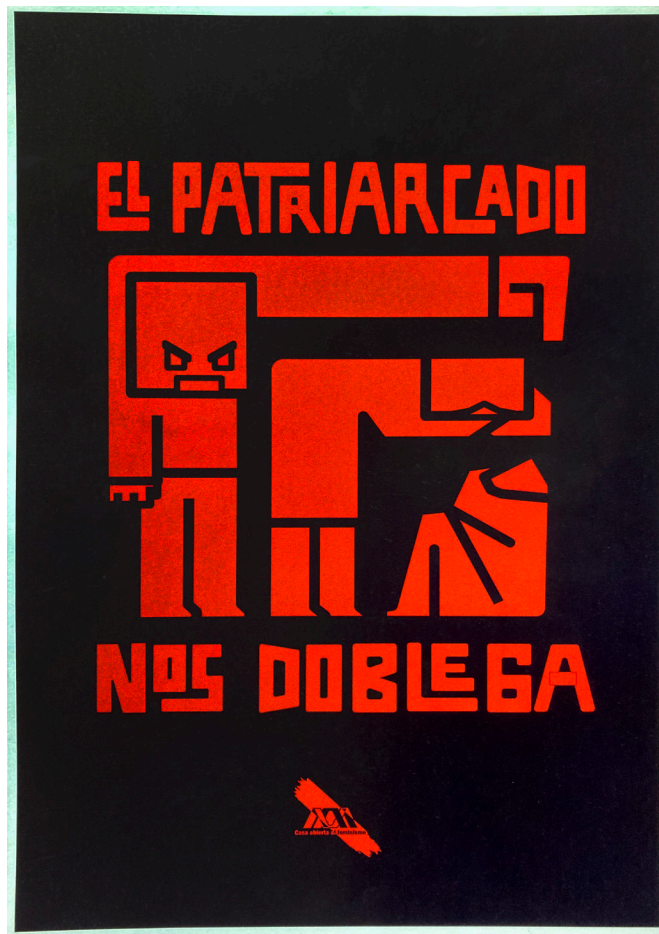
Figura 5 El patriarcado nos doblega

Nota. Cartel desarrollado en el Laboratorio de Diseño Integral III, trimestre 23-I, Ozuna Esquivel, 2023.