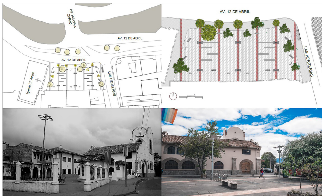
Figura 5. Ubicación, emplazamiento, fotografía anterior y posterior a la intervención de la Plaza El Vergel

Por medio de la intervención, ejecutada bajo la supervisión de la Fundación Municipal El Barranco en 2006, se buscó facilitar el acceso al espacio público mediante la eliminación de obstáculos visuales y el rediseño del pavimento además de la incorporación y sustitución del mobiliario y la instalación de una pileta de agua a nivel del piso (Cedillo, 2021).