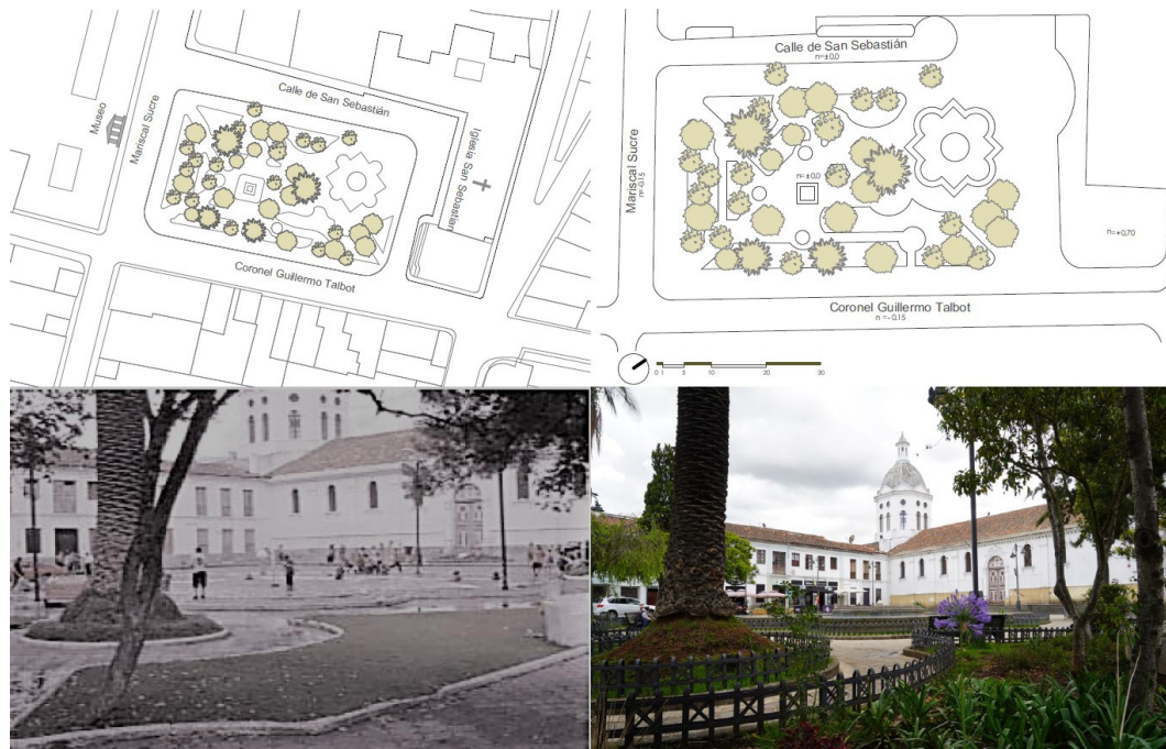
Figura 6. Ubicación, emplazamiento, fotografía anterior y posterior a la intervención del Parque San Sebastián

El espacio estuvo descuidado por varios años y el sector en general se mantuvo en precarias condiciones (Guerra y Román, 2004), por lo que en 2007 la Unidad Ejecutora del Centro Histórico intervino en el parque rediseñando el piso y generando una sola plataforma con la entrada lateral de la Iglesia de San Sebastián, con la idea principal de vincularla al parque. También se dio mantenimiento al mobiliario y arbolado (Farfán, 2008).