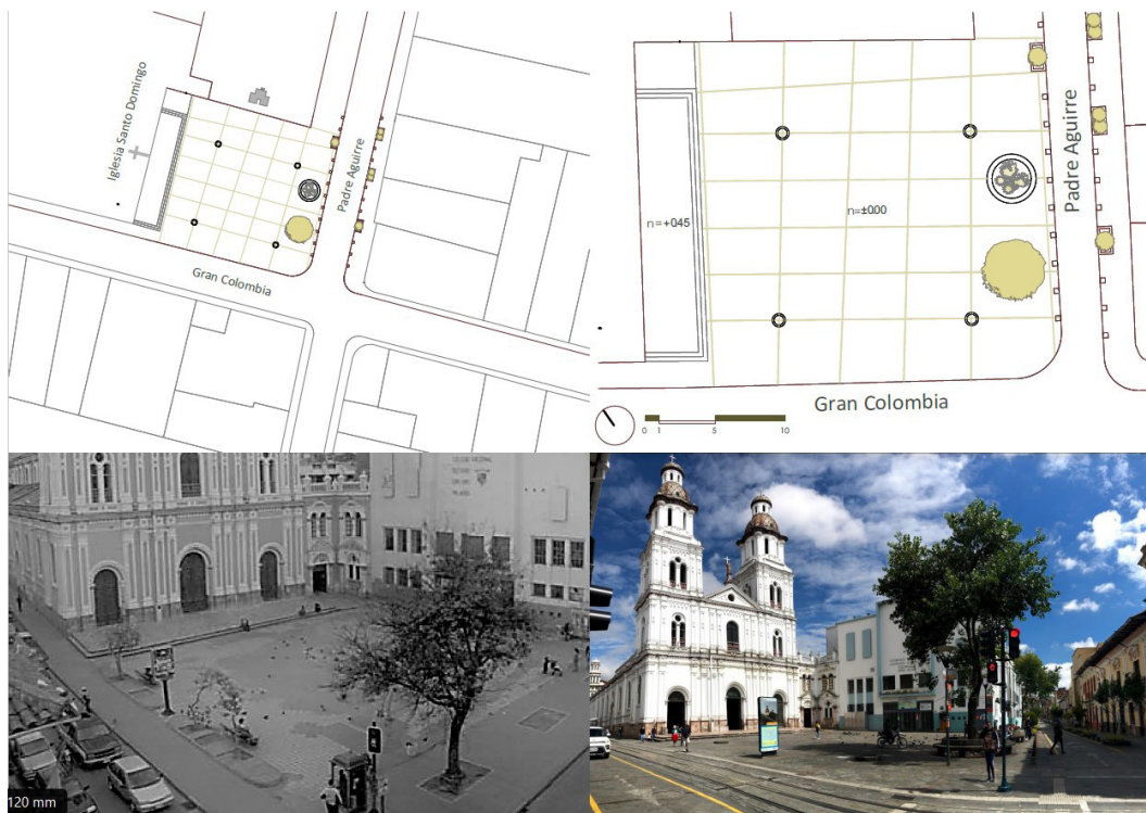
Figura 3. Ubicación, emplazamiento, fotografía anterior y posterior a la intervención de la Plaza Santo Domingo

La última intervención fue ejecutada en 2008 por la Unidad Ejecutora del Centro Histórico, generando una sola plataforma con las calles de su alrededor. El objetivo principal consistió en reducir la velocidad vehicular, dar prioridad al peatón y potenciar las conexiones urbanas. No se modificó su trazado y distribución, pero sí se colocaron bancas circulares, luminarias y dos fuentes de agua en la zona este, quedando la mayor parte de la plaza descubierta y sin mobiliario (Zabaleta, 2016).