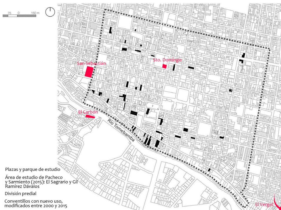
Figura 12. Estudio que demuestra que, de 67 viviendas colectivas populares en el año 2000, 42 modificaron su uso a comercio en el año 2015 (Pacheco y Sarmiento, 2017)

Ya en las entrevistas van apareciendo posibles causas que confirman los hallazgos de las fichas físico-espaciales. Por una parte, los entrevistados señalaron como aspecto negativo la falta de usos diversos, que sí existían en el pasado, y cómo esta circunstancia no aporta a la vida de barrio. Entendiendo esta última como la serie de dinámicas relacionadas a los habitantes, quienes residen en la zona (Borja, 2013). Dicha afirmación está relacionada a la pérdida de vivienda en el centro histórico, dato que aparece en varios estudios como el de Cabrera (2019), Pacheco y Sarmiento (2015) (Fig. 12), y Hermida et al. (2015), y en los datos censales del INEC en los que se observa la disminución de vivienda en la zona patrimonial.