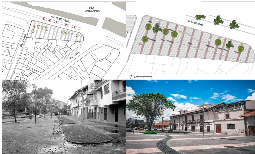
Figura 4. Ubicación, emplazamiento, fotografía anterior y posterior a la intervención de la Plazoleta El Carbón

La intervención a cargo de la Fundación Municipal El Barranco, culminó en 2006 y tuvo como objetivo principal mejorar las condiciones físicas para potenciar la zona y el eje entre los barrios de San Roque y San Sebastián. Se planteó la sustitución e incorporación de mobiliario (bancas, luminarias y basureros), y se incluyó una fuente de agua a nivel de piso e integrada a la línea de arbolado (Cedillo, 2021).