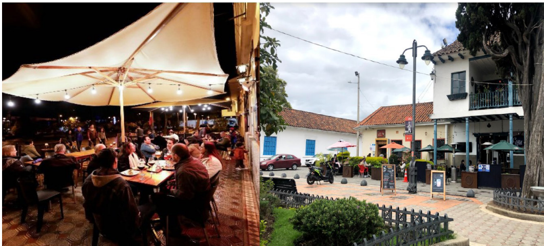
Figura 13. Restaurantes en los bordes del Parque San Sebastián

En este sentido, es importante equilibrar la vivienda con el comercio, y sobre este último inclusive diversificar los tipos de comercio, incluyendo usos cotidianos relacionados a la vivienda tanto en la primera línea edificada como dentro de los espacios públicos, evitando los usos focalizados ligados a un