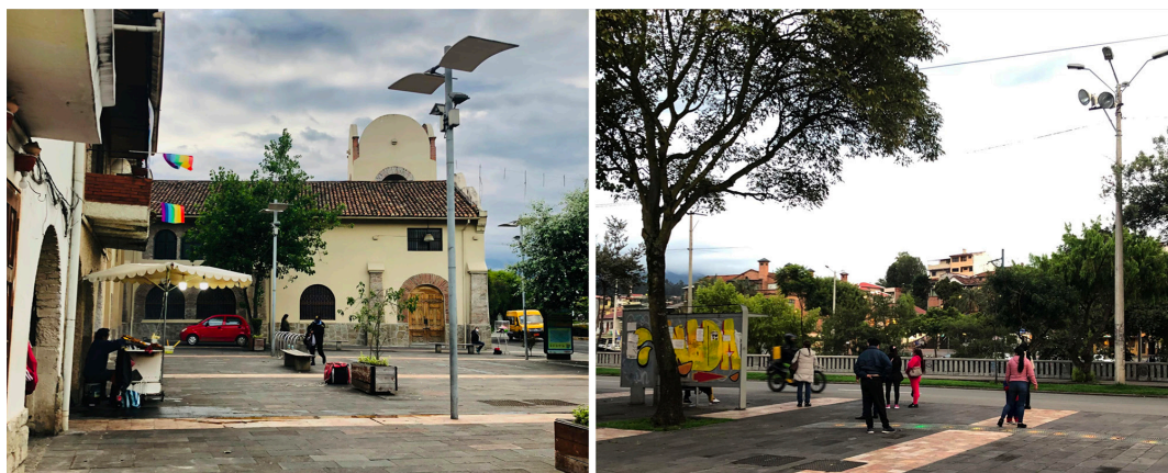
Figura 9. Comercio itinerante en la plaza El Vergel y espera del transporte público en la plazoleta El Carbón

Por una parte, se observó falta de mantenimiento del mobiliario, del mismo modo, las fuentes de agua, no se encuentran en condiciones óptimas y su funcionamiento es nulo (Fig. 10). Además, algunas de las bancas no son ergonómicas como en la