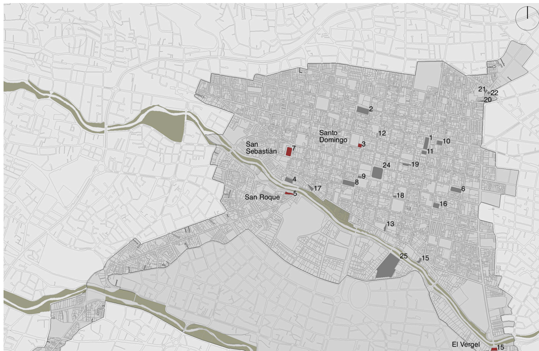
Figura 2. Centro Histórico de Cuenca, plazas, parques y casos de estudio

Fundación Municipal El Barranco y Unidad Ejecutora del Centro Histórico. Se consideró además que los proyectos de intervención hubieran culminado hace más de una década, de tal manera que el periodo de análisis contemplara como mínimo diez años. Los espacios que mejor se ajustaron a estas condiciones fueron: Plaza Santo Domingo, Plazoleta El Carbón, Plaza El Vergel y Parque San Sebastián (Fig. 2).