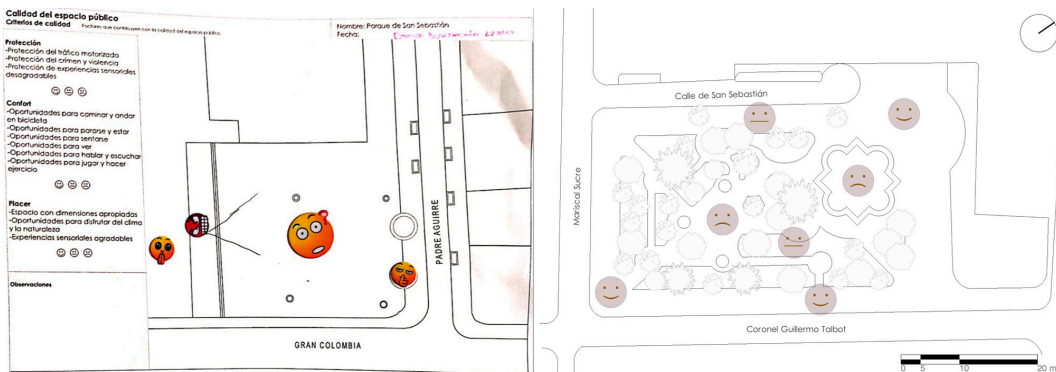
Figura 8. Ficha de levantamiento de la Plaza Santo Domingo y plano procesado del Parque San Sebastián, con la información del taller participativo

participantes elaboraron un mapa en el que mediante varios adhesivos representaron distintos estados de ánimo (Fig. 8). Debido a las restricciones tomadas en el marco de la pandemia de Covid 19, esta fase se llevó a cabo en dos de los espacios públicos analizados: parque San Sebastián y plaza Santo Domingo, en los que participaron 6 y 8 usuarios respectivamente.