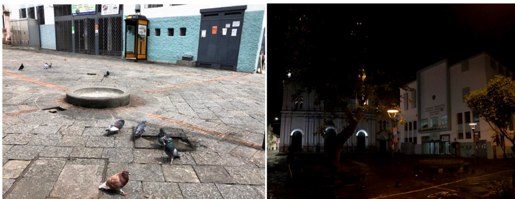
Figura 10. Fuentes de agua en mal estado y falta de iluminación en la plaza Santo Domingo