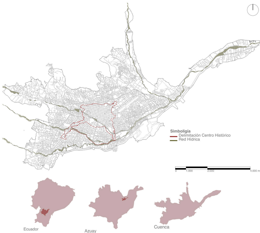
Figura 1. Ubicación y mapa de la ciudad de Cuenca

La declaratoria UNESCO no solo implicó el reconocimiento de los valores patrimoniales del centro histórico cuencano, sino la implementación de una política de conservación de sus bienes. Con este fin, el Gobierno Autónomo Descentralizado de Cuenca promovió planes, programas y proyectos para revitalizar el espacio público de la ciudad histórica (GAD Municipal de Cuenca, 2016), dentro