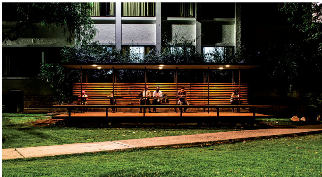
Figura 3. Acupuntura en el campus

Diseñar unidades reproducibles, sin embargo, no significa aplicar una fórmula cerrada en la que no se admiten nuevas soluciones, sino más bien significa que cada espacio, con sus propias exigencias, impone nuevos problemas y por ende sugiere diversas soluciones que obligan a examinar los diseños preexistentes, a reemplazarlos, si es del caso, o a transformarlos. El proyecto implementa, además, piezas de arte urbano (c), que simbolizan la vida de la antigua escuela de las Madres Dominicanas. Las piezas, del artista cuencano Jorge España, representan a monjas y a estudiantes, son de metal fundido y se ubican en lugares estratégicos para ayudar a definir espacios; son hitos que atraen la mirada del usuario y provocan sinergias y momentos lúdicos.