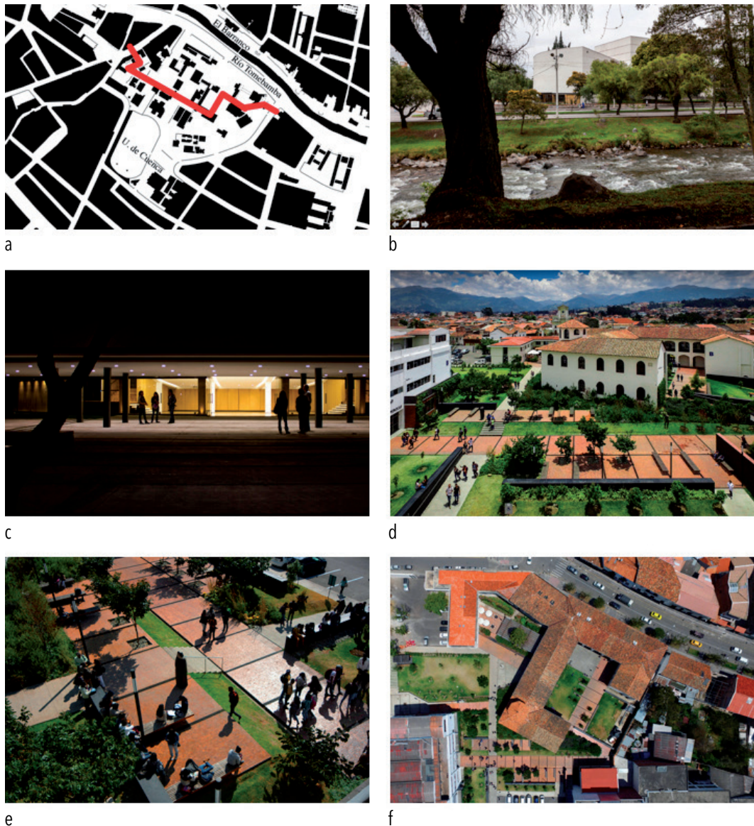
Figura 2. Del teatro a la Iglesia

Fuente: (a) Plano de la Universidad de Cuenca, con el recorrido Este-Oeste, del teatro a la iglesia (Unidad de Planificación Física de la Universidad de Cuenca, 2008-2015). (b) Vista del teatro Carlos Cueva desde el Río Tomebamba (Unidad de Planificación Física de la Universidad de Cuenca, 2008-2015. Fotógrafo: Sebastián Crespo). (c) Vista del acceso-plaza del Teatro Carlos Cueva (Unidad de Planificación Física de la Universidad de Cuenca, 2008-2015. Fotógrafo: Fernanda Aguirre). (d) Antigua Escuela Madres Dominicanas (Unidad de Planificación Física de la Universidad de Cuenca, 2008-2015. Fotógrafo: Francisco Coronel). (e) Vista aérea ingreso a varios edificios en el sector oeste (Unidad de Planificación Física de la Universidad de Cuenca, 2008-2015. Fotógrafo: Francisco Coronel). (f) Vista aérea antigua Escuela Madres Dominicanas y Facultad de Economía, 2008-2015. Fotógrafo: Francisco Coronel).